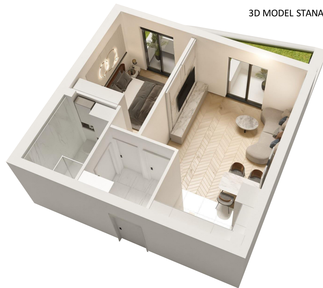
3D MODEL STANA